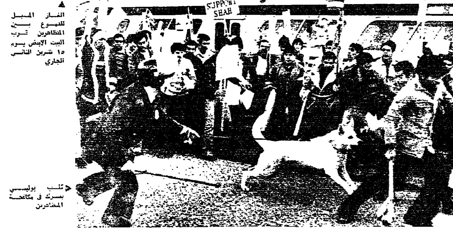
مكتب بوليسي... سرك في مكانة المظاهرين